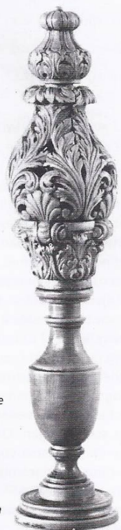
Een Hollandse koning uit de 17de eeuw, gesneden uit buxus. De kroon van de koning kan worden opengeklapt. Dan verschijnt een nar met blote billen. Hiermee kan de verliezer zijn mening kenbaar maken aan de winnaar.

grondinformatie. Prijs € 56.45, exclusief verzendkosten. Bestellen via www.chessmen.eu .