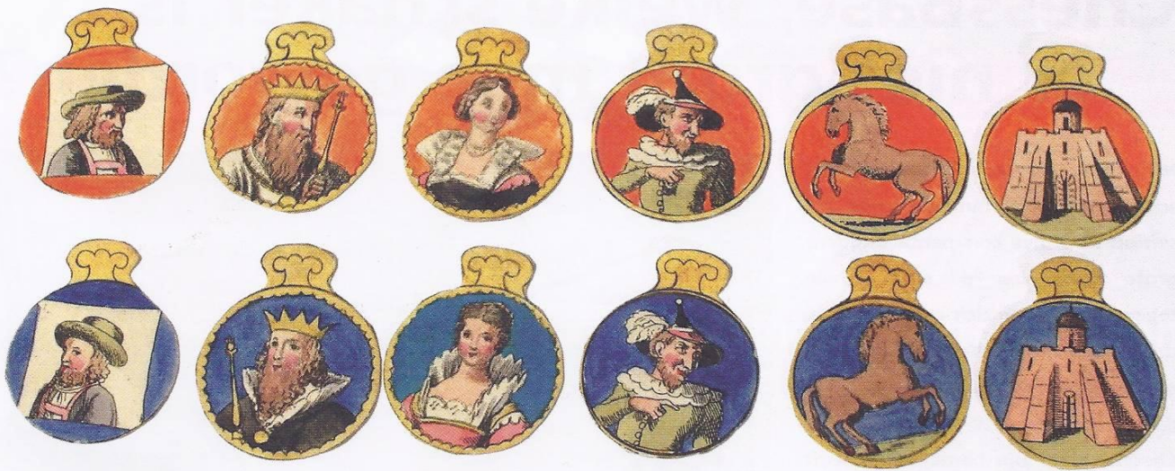
De beroemde Mindermann schaakfiguren (Amsterdam 1830). Alle figuren zijn met de hand getekend en gekleurd.

weken rekenen. Al zijn er ook veel goede uitzonderingen.