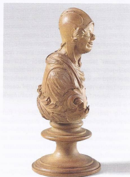
De schaakfiguur van Adriaen van der Werff is niet een pion, zoals in de omschrijving van het Rijksmuseum staat.